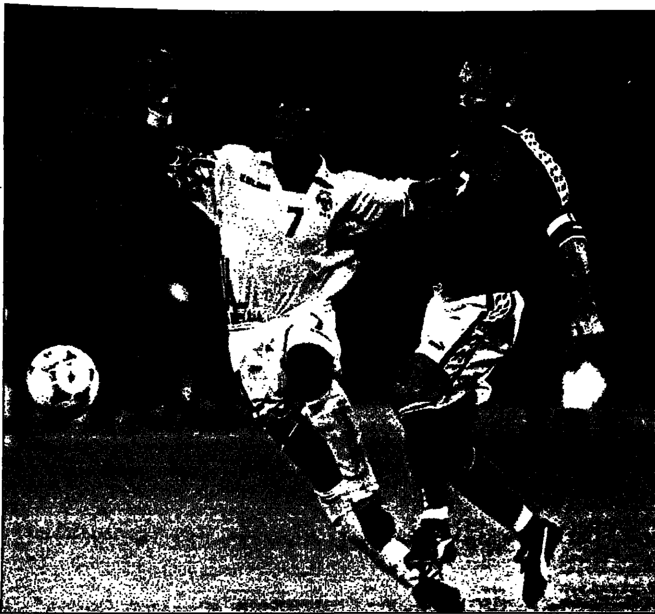
لحظة من مباراة فريق الإمارات (صورة من الأرشيف)